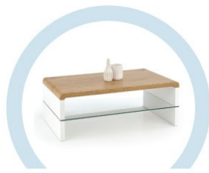
ЖУРНАЛЬНЫЕ СТОЛИКИ И ПРОЧИЕ ЖЕСТКИЕ ПОВЕРХНОСТИ