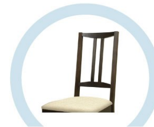
СПИНКИ СТУЛЬЕВ, НЕ ОБИТЫЕ ТКАНЬЮ И МЯГКИМ ПОРИСТЫМ МАТЕРИАЛОМ