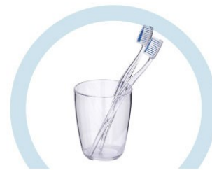
ТУАЛЕТНЫЕ ПРИНАДЛЕЖНОСТИ (ЗУБНЫЕ ЩЕТКИ, РАСЧЕСКИ И ПР.)