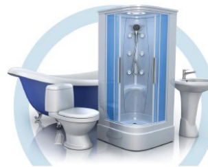
ТУАЛЕТ (УНИТАЗ, ВАННА, ДУШЕВАЯ КАБИНА, БИДЕ)