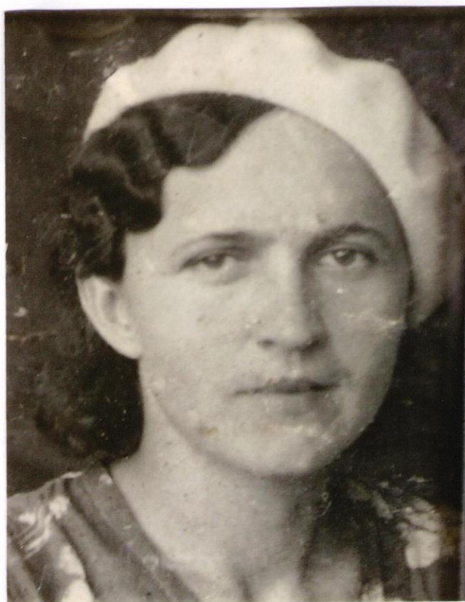
2 МАЯ 1941 г.