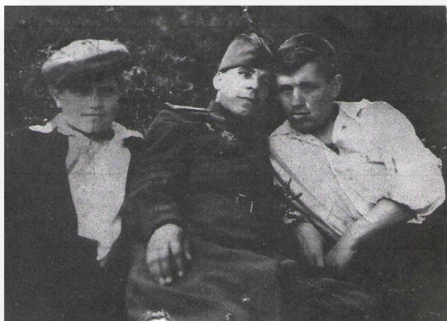
1945 год. Возвращение домой.